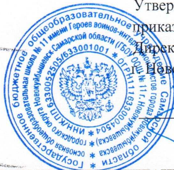
ГРАФИК ГОРЯЧЕГО ПИТАНИЯ ОБУЧАЮЩИХСЯ