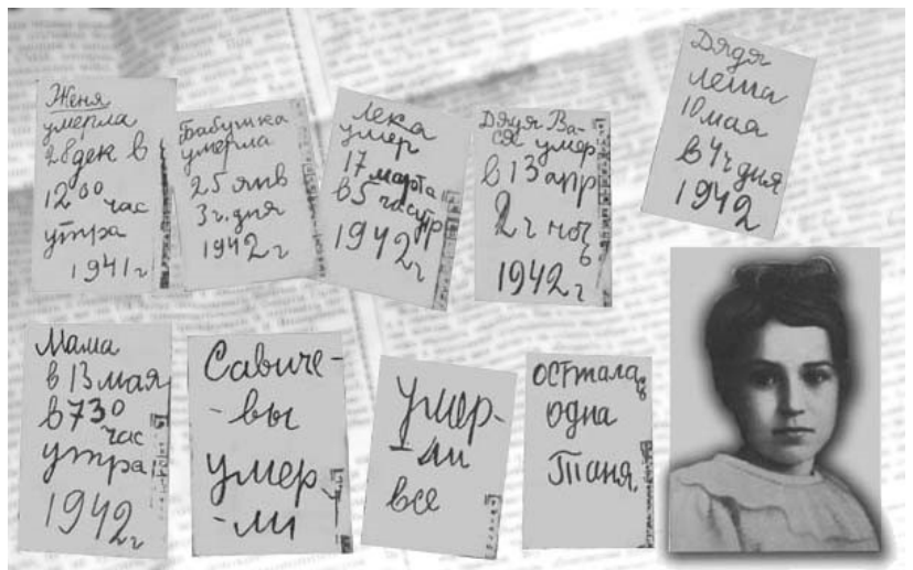
Это дневник Тани Савичевой. Она писала каждый день на его страничках о смерти от голода своих близких людей. Сама девочка умерла уже в эвакуации от тяжёлой болезни.

Воспоминания о блокаде Ленинграда людей, переживших её, их письма и дневники открывают нам ужасную картину. На город обрушился страшный голод. Обесценились деньги и драгоценности. Эвакуация началась ещё осенью 1941 года, но лишь в январе 1942 года появилась возможность вывести большое количество людей, в основном женщин и детей, через До-